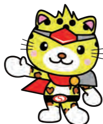
兵庫県社会福祉士会 オリジナルキャラクター 兵之助くん

あなた自身や家族の方が生活の中で困ったことがあった時に、お話をよくうかがって、解決するために 最も適したサービスに「つなげる」という 役割を担います。